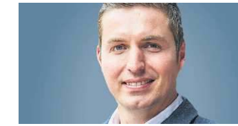
Pieter van den Hoogenband

„Een fenomeen, een technisch mirakel. Ik heb nog nooit, tot op de dag van vandaag, iemand zo goed zien zwemmen als hij. Iemand met het meeste watergevoel ter wereld. Ik ken geen betere, ook Michael Phelps niet. Pieter is voor mij nog steeds het voorbeeld van de ultieme zwemmer. Dan moeten we het starten en het keren even vergeten. Het gemak waarmee hij kan zwemmen – ongekend. Hij was ook zonder polijsten al een diamant.”