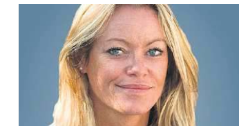
Inge de Bruijn

„Een fenomeen, een technisch mirakel. Ik heb nog nooit, tot op de dag van vandaag, iemand zo goed zien zwemmen als hij. Iemand met het meeste watergevoel ter wereld. Ik ken geen betere, ook Michael Phelps niet. Pieter is voor mij nog steeds het voorbeeld van de ultieme zwemmer. Dan moeten we het starten en het keren even vergeten. Het gemak waarmee hij kan zwemmen – ongekend. Hij was ook zonder polijsten al een diamant.”